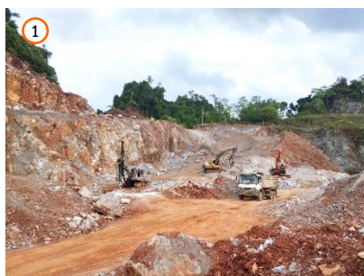
พื้นที่หน้าเหมือง