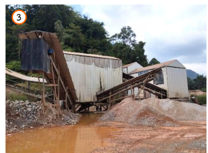
โรงโม่หินของโครงการ