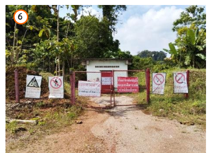
สถานที่เก็บวัตถุระเบิด