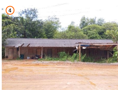
บ้านพักพนักงาน