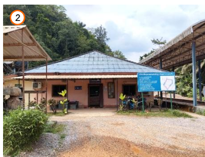
สำนักงานของโครงการ