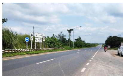
ทางหลวงหมายเลข 44