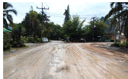
เส้นทางเข้า-ออกด้านหน้าพื้นที่โครงการ