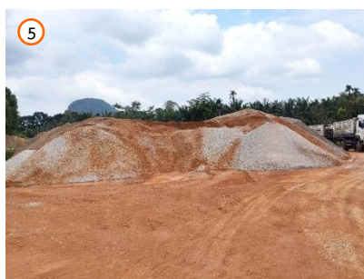
พื้นที่ลานกองแร่