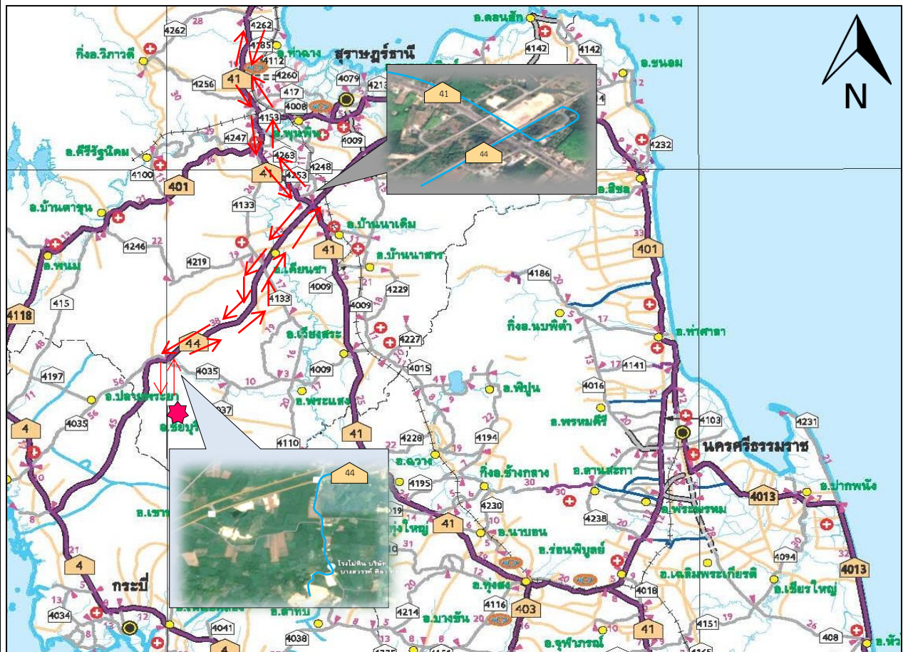
รูปที่ 1-3 แสดงการคมนาคมเข้าสู่พื้นที่โครงการ